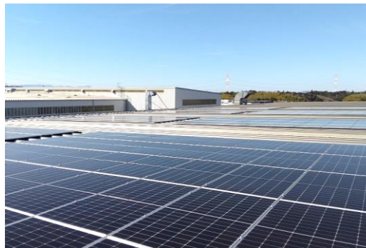
関西工場 太陽光パネル設置 (完成イメージ)