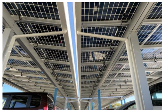
ソーラーカーポート